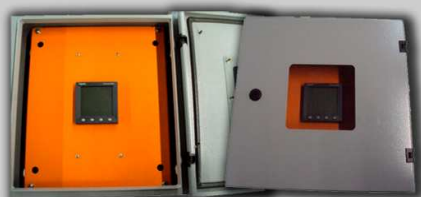
Quadros de medição e faturamento