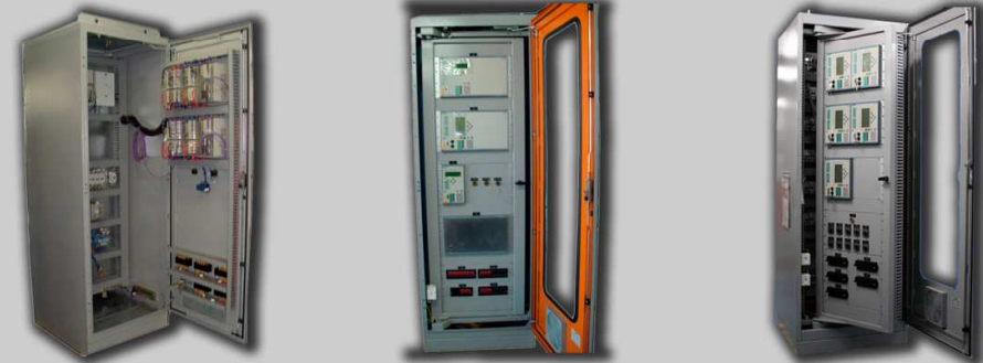
Painéis de proteção de geradores