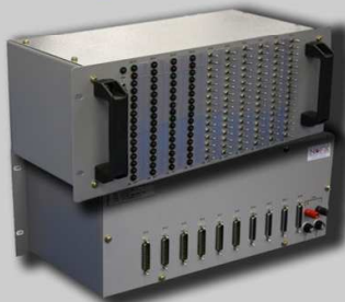
Gigas de teste