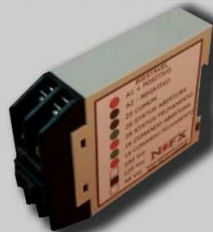
Relés biestáveis monofásicos