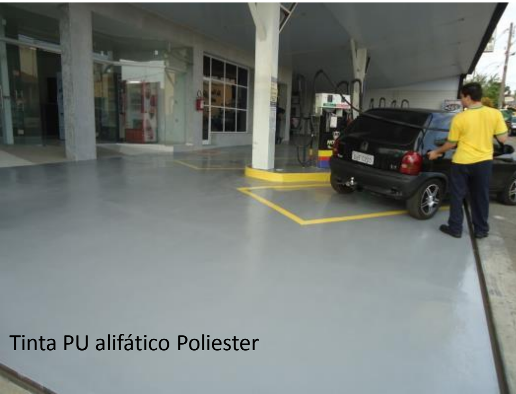
Tinta PU alifático Poliester