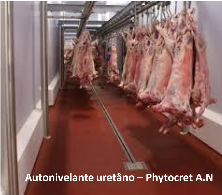
Autonivelante uretano – Phytocret A.N