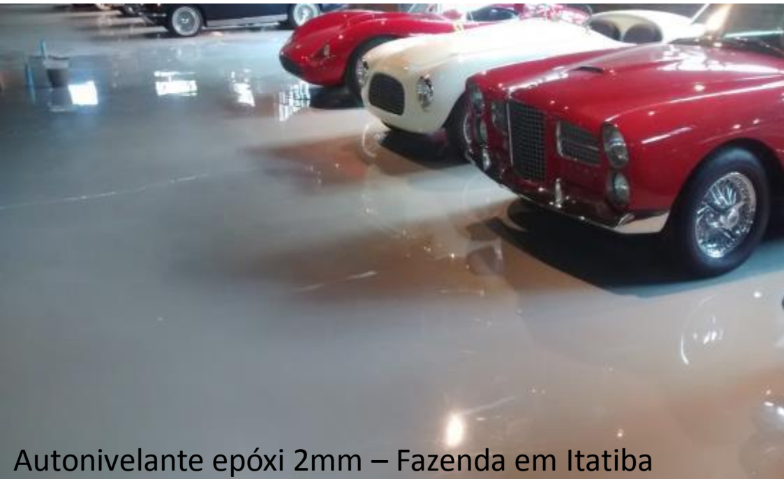
Autonivelante epóxi 2mm – Fazenda em Itatiba