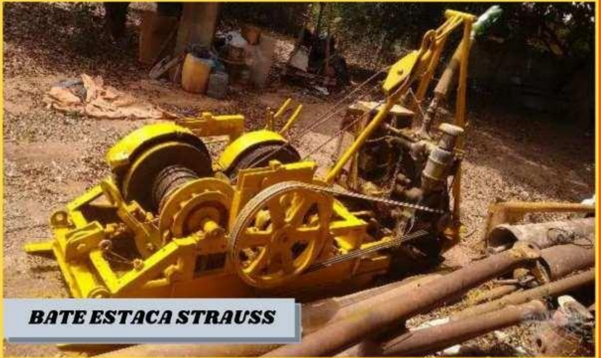
BATE ESTACA STRAUSS